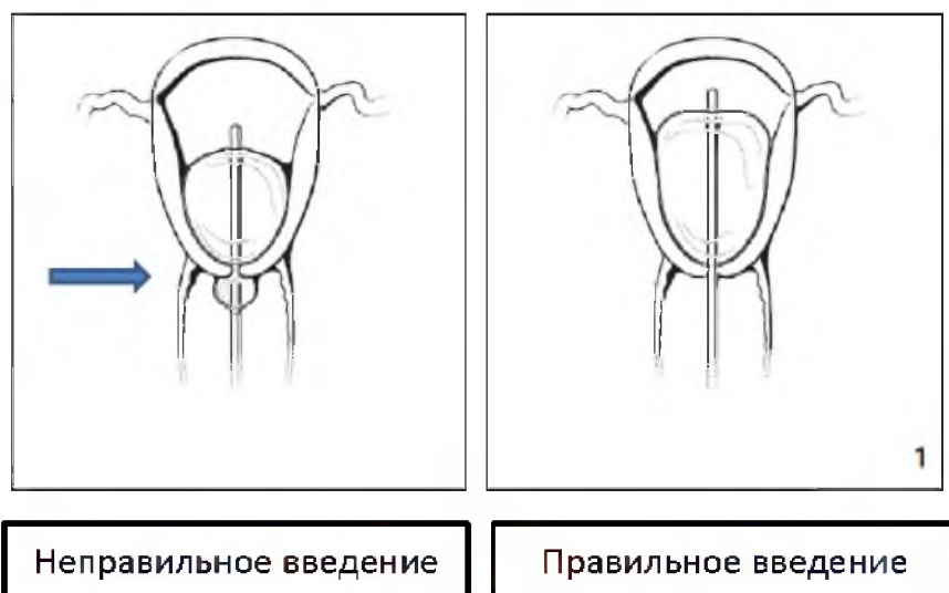
Рис. 1. Размещение внутриматочного баллона